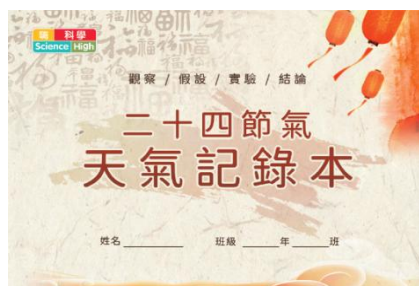
二十四節氣紀錄本