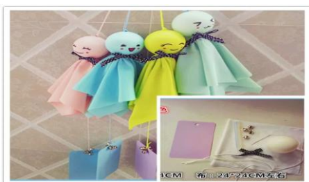
天氣娃娃材料包(親膚紗布巾、手工串珠、緞帶、支撐內容球體)