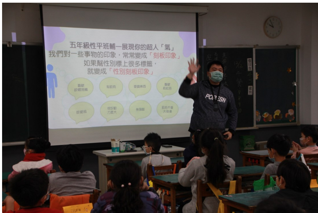
相片說明：入班宣導-多元性別氣質