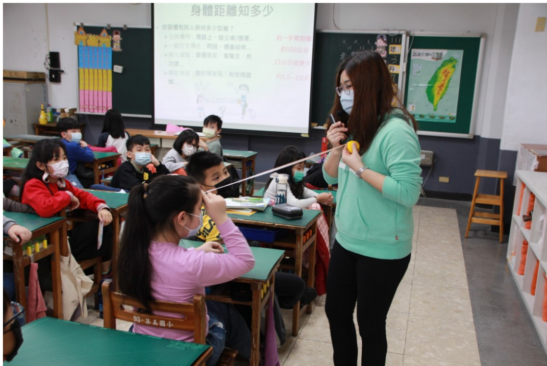
相片說明：入班宣導-身體界線