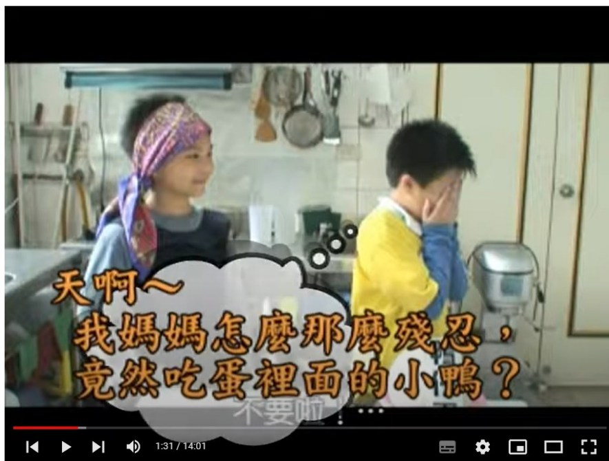
集美劇場 70多元文化你和我～交換媽媽俱樂部