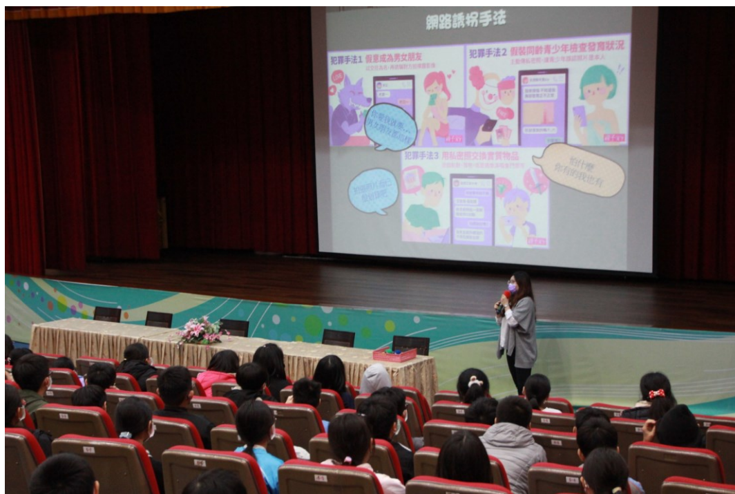
相片說明：學生講座-數位性暴力