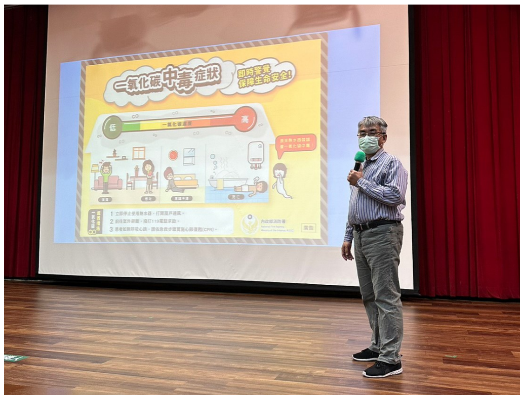
相片說明：資源教育-辦理『防範一氧化碳安全』宣導