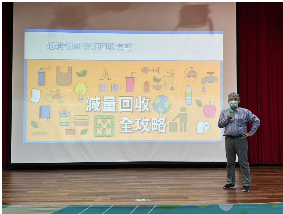
相片說明：資源教育-辦理『低碳校園資源回收』宣導